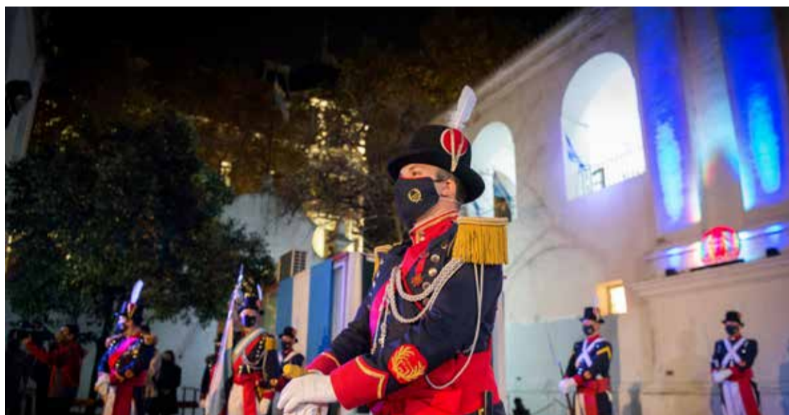
Cambio de la guardia de honor del Cabildo de la ciudad de Buenos Aires.