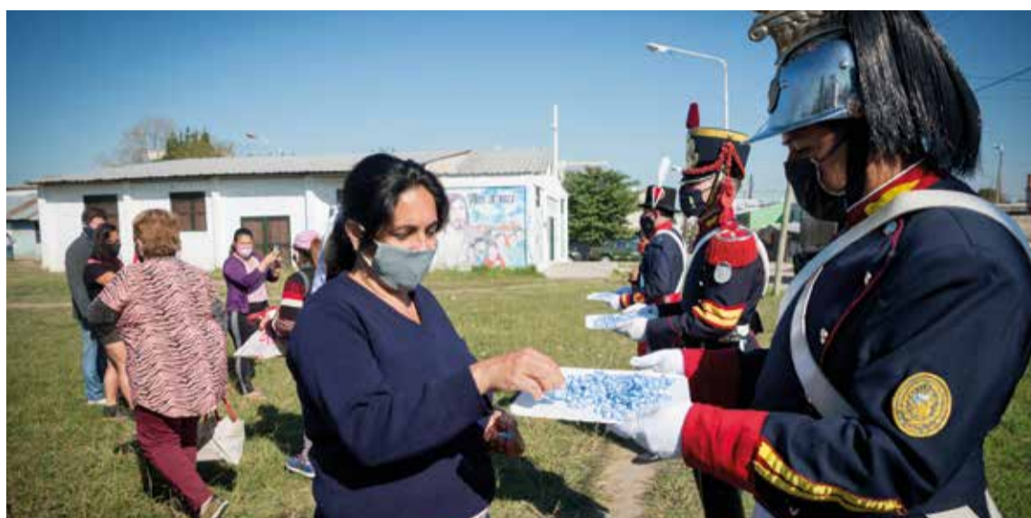
Integrantes de la Fuerza, vestidos con sus uniformes históricos, regalan escarapelas a vecinos de La Matanza.