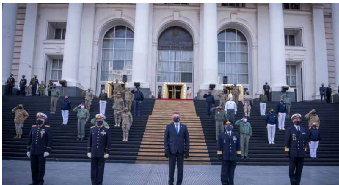
Formación en homenaje al Primer Gobierno Patrio en la explanada del edificio Libertador.